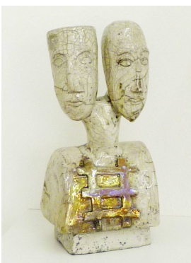
Algaida 2014 / 35 x 15 x 13 / Raku: Krakelee-Glasur, Silber-Glasur

MH: Ich war sehr überrascht, dass diese zwei Bilder stärkere Farben haben, als z.B. die drei rechts aus 2008 ("Whiling Time", "Nerja" und "Whereabouts"), die damals für mich sehr intensiv wirkten. Ich würde sagen, es hat sehr viel mit dem sehr dicken, fast wie Karton, handgeschöpften Papier, das ich als neue Grundlage benutzt habe, zu tun. Ich male oft viele Farbschichten übereinander. Bei dieser besonderen Textur, kann man dadurch die verschiedenen Farben sehen. Das gibt Tiefe, die sehr lebendig und expressiv ist. In diesem Fall besteht die "re-invention" darin, meine Lieblingsmotive mit neuem Material und anderer Technik zu interpretieren. Ich wollte am Anfang etwas anderes malen (sie lacht).