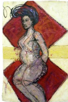
Still Moving II 2014 / 102 x 68 / Acryl auf handgeschöpftes Papier Foto: Margaret Hunter

II: Zu der neueren Arbeiten, die konkret für diese Ausstellung vorbereitet wurden, gehören die Bilder " Heads Together " und " Still Moving II ". Sie haben eine besondere Ausstrahlung, sehr starke Farben und es fällt eine besondere Plastizität auf. Wie kam es dazu? Was hat dich inspiriert?