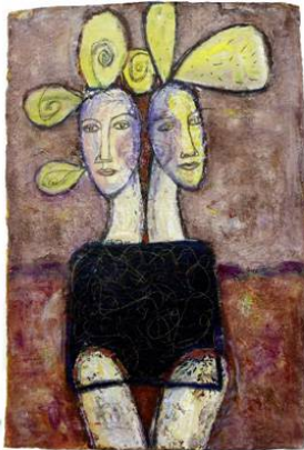
Heads Together 2014 / 102 x 68 / Acryl auf handgeschöpftes Papier Foto: Margaret Hunter