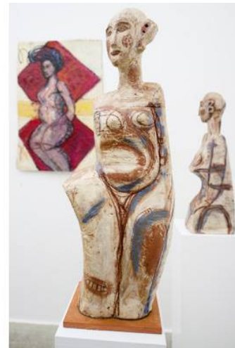
Glindow Frau 2003 / 80 x 32 x 23 / Keramik

II: Zum Beispiel in der Skulptur " Network " aus 2012, was symbolisiert der Trichter?