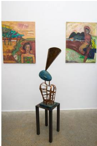
Network 2012 / 93 x 32 x 31 / Holz und Kupfer

MH: Ja, das war Chiara, eine Kunststudentin in Edinburg, sie hat aber zwei Ohren (sie lacht). Sie hat Yoga gemacht, war sehr präsent und strahlte viel Energie aus. Chiara hat ihre Haare so eingedreht wie "Schnecken" getragen. Sowieso ist die Spirale für mich ein wichtiges Symbol, es findet immer wieder eine neue Bedeutung in den Bildern oder Skulpturen. Das ist eine "re-invention" an sich. Ich habe weitere geometrische Formen in meinem Repertoire, deren Bedeutung sich ständig verändert. Zum Beispiel das Dreieck wird zum Trichter oder Pfeil, die Spirale wird zur Kugel.