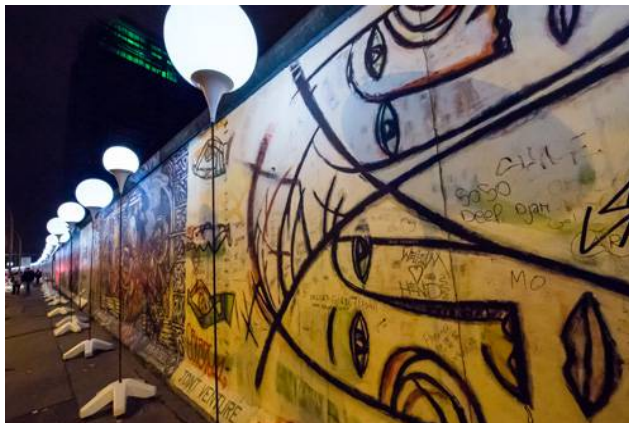
Joint Venture, 2014 / East Side Gallery

II: Rückblickend finden wir dieses Motiv auf dem Bild Joint Venture auf der ehemaligen Mauer und dessen Galerie-Version, die wir bei der letzten Ausstellung re:STATEMENT gezeigt haben.