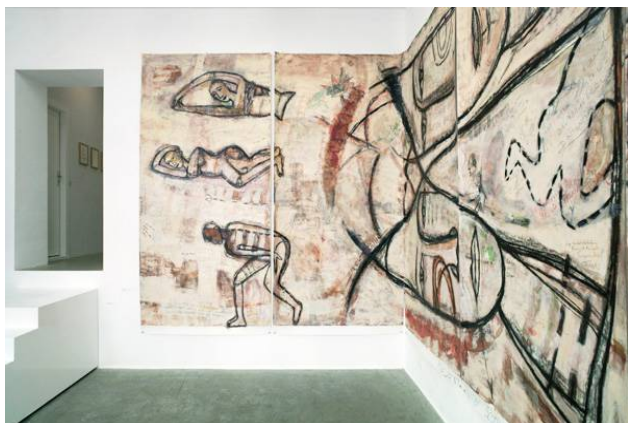
re:STATEMENT aquabitArt Galerie 2011