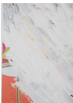
Zsuzsa Klemm, melusine