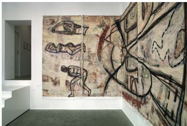
Joint Venture, re:STATEMENT, 2009/2010 5 Segmente, Acryl auf Karton 300 x 710 cm