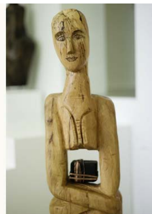
Holding Hope (Detail), 2006 Buche, Kupferdraht, Farbe 146 x 30 x 21,5 cm